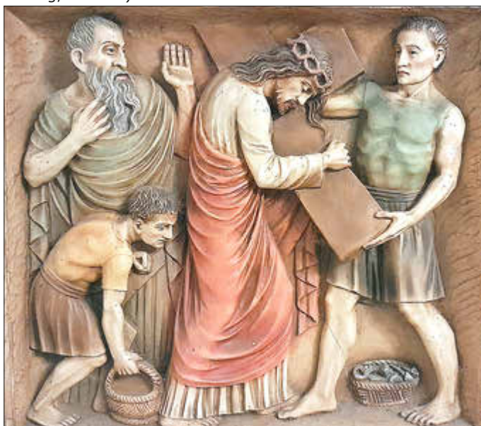
Kreuzwegrelief, Pfarrkirche Nennig