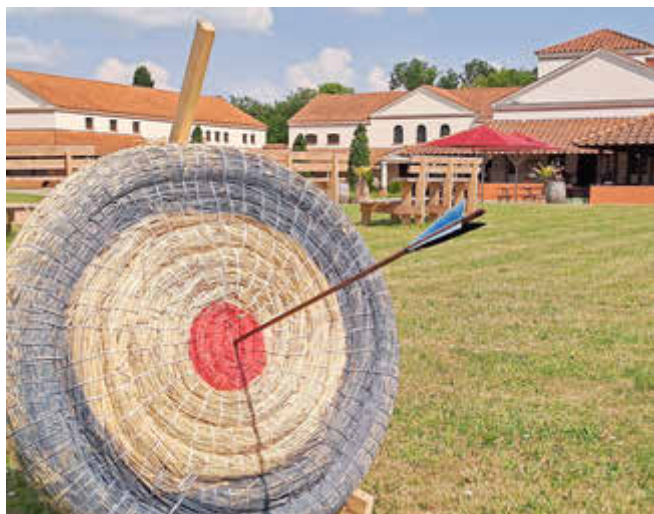
Mit Pfeil und Bogen gehen die Teilnehmer des Ferienprogramms in der Villa Borg auf „Stroscheiben-Jagd“.

Die Teilnehmerzahlen sind begrenzt, eine Anmeldung unter Angabe der Kontaktdaten ist erforderlich unter Tel. 06865-9117-0 oder über info@villa-borg.de .