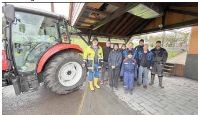
Helferinnen und Helfer