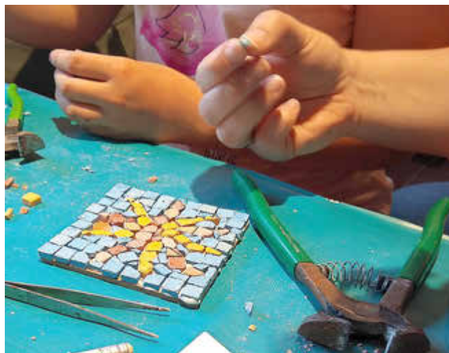
Bei dem Mitmachmodul „Mosaiklegen“ sind Geduld und Fingerspitzengefühl gefragt.