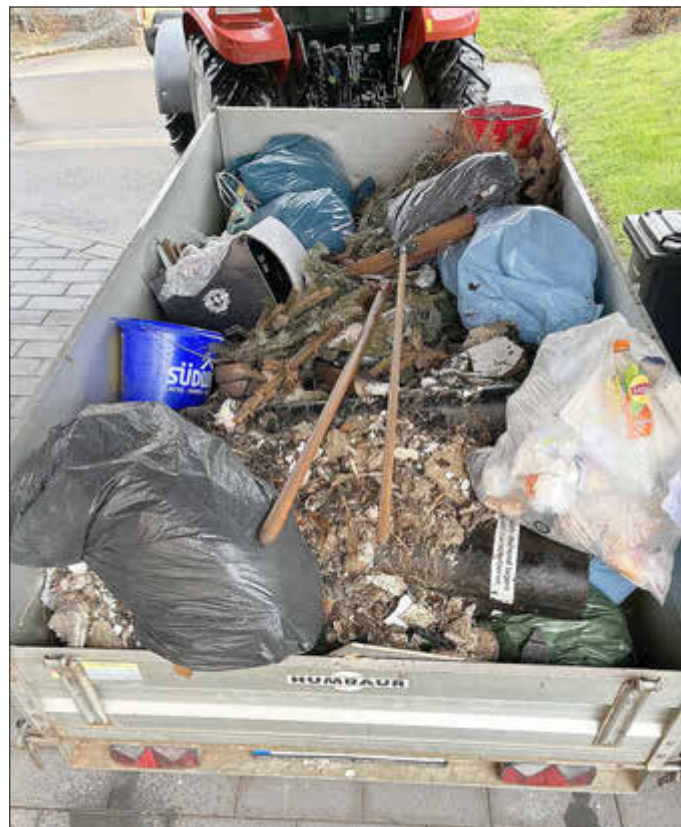
Sammelergebnis auf dem großen Anhänger